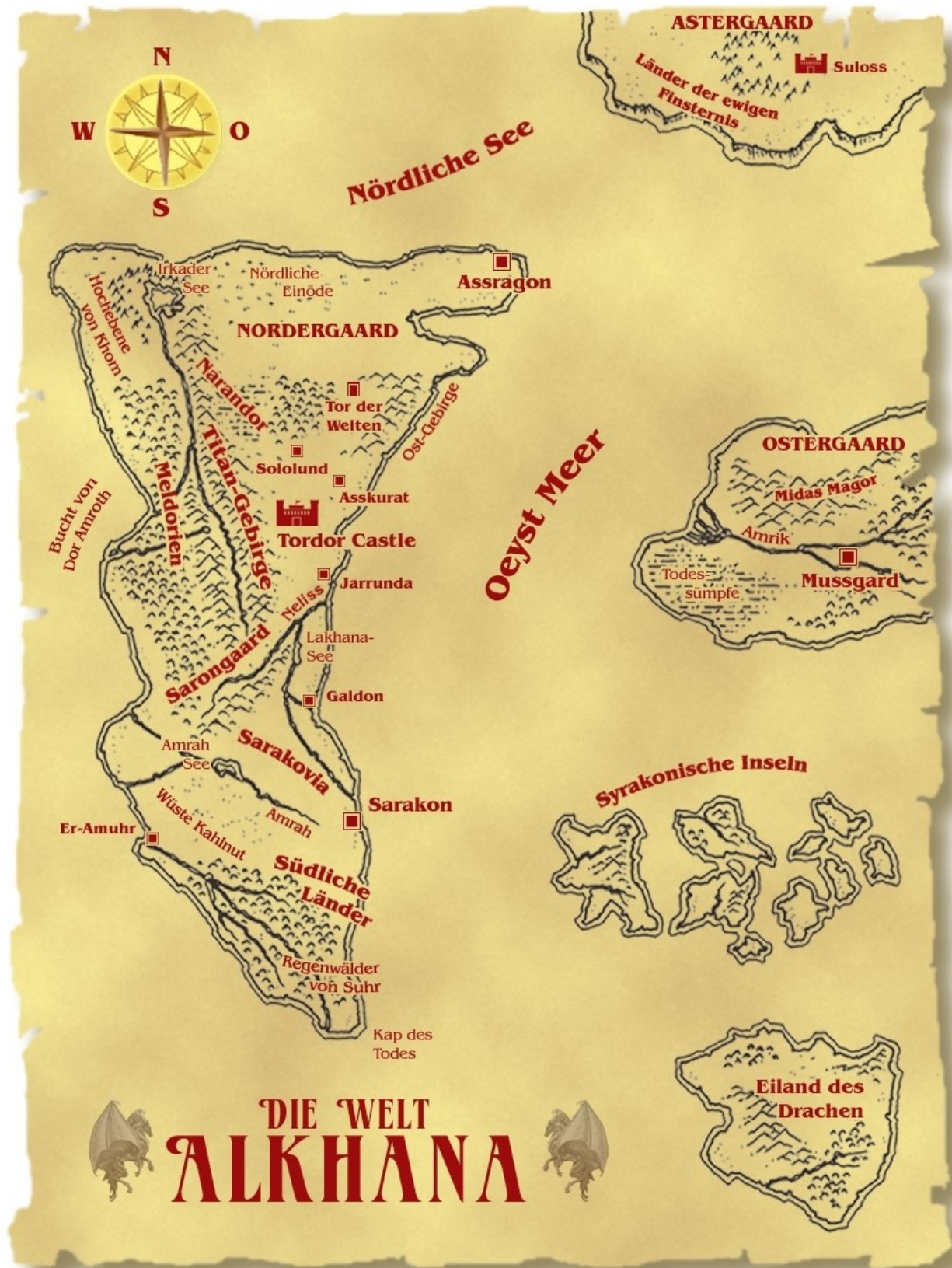
Karte (c) 2006 by Thomas Knip